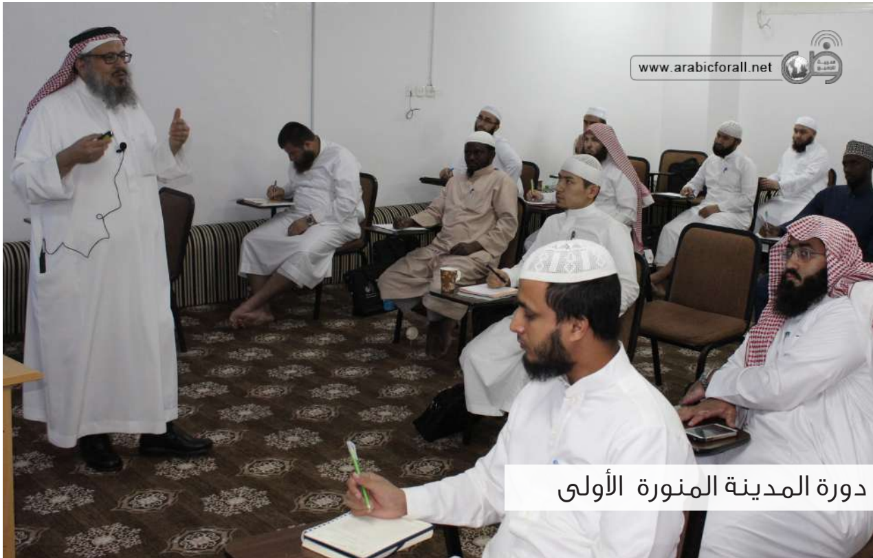
دورة المدينة المنورة الأولى