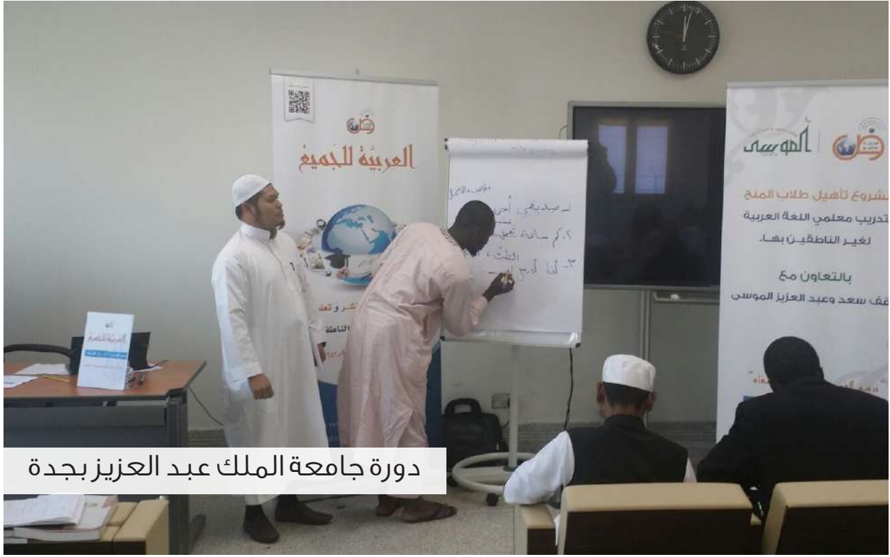
دورة جامعة الملك عبد العزيز بجدة