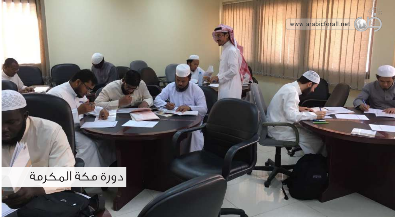
دورة مكة المكرمة