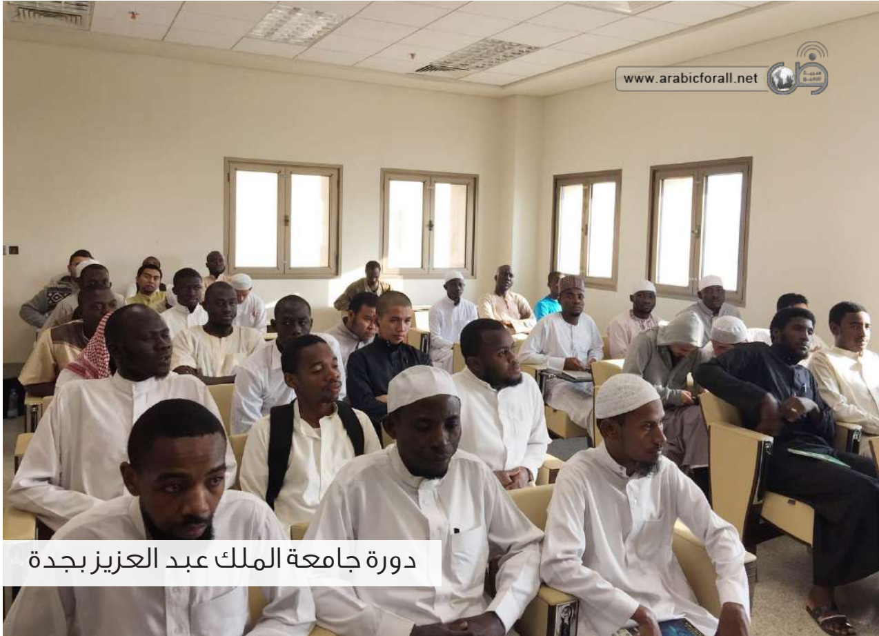
دورة جامعة الملك عبد العزيز بجدة