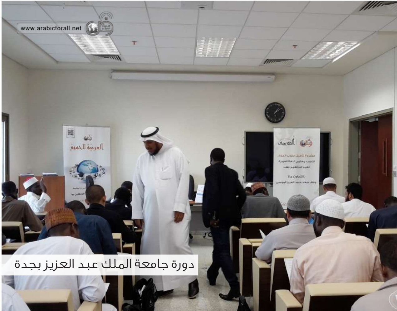
دورة جامعة الملك عبد العزيز بجدة