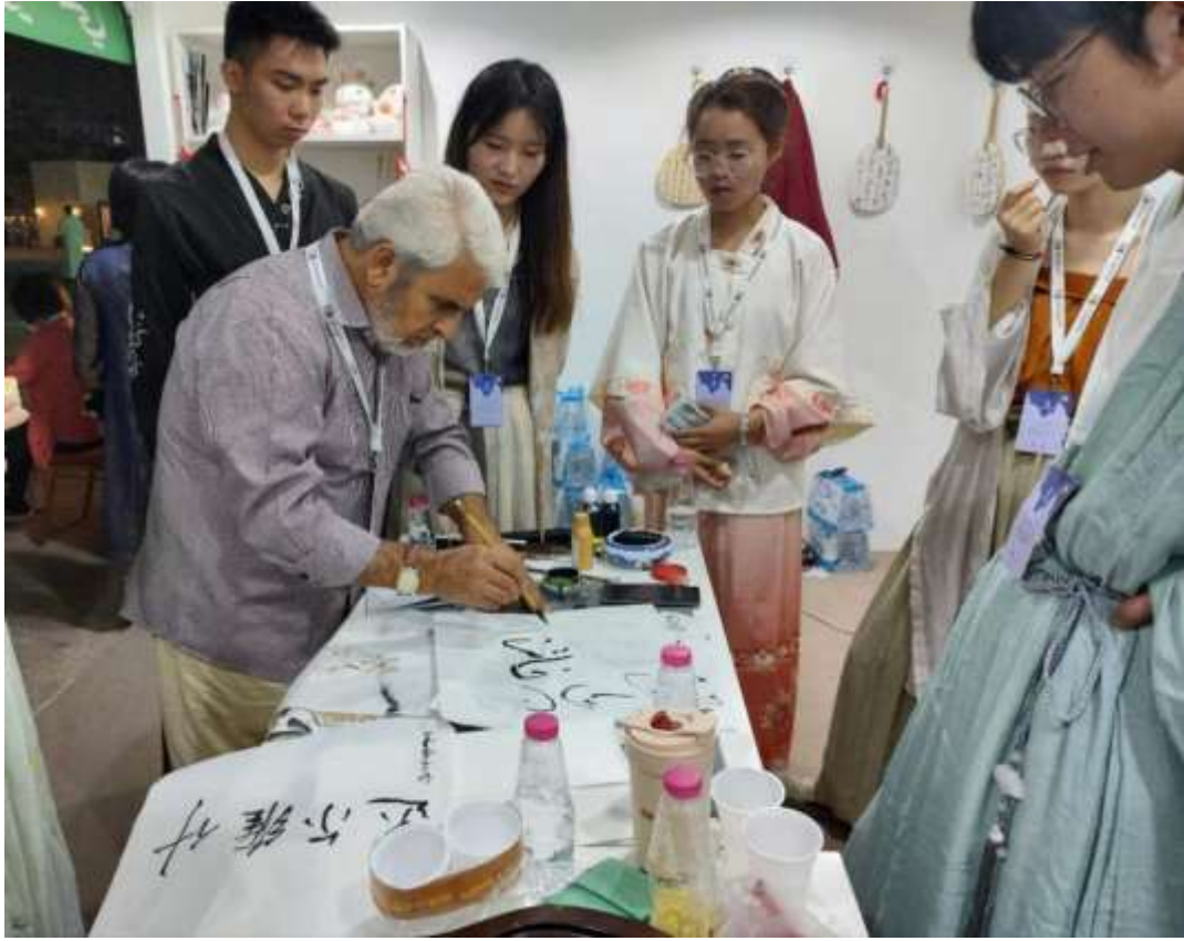
(صورة تظهر أصدقاء إماراتيين يجتربون الورق والحبر ويظهرون الخط العربي)