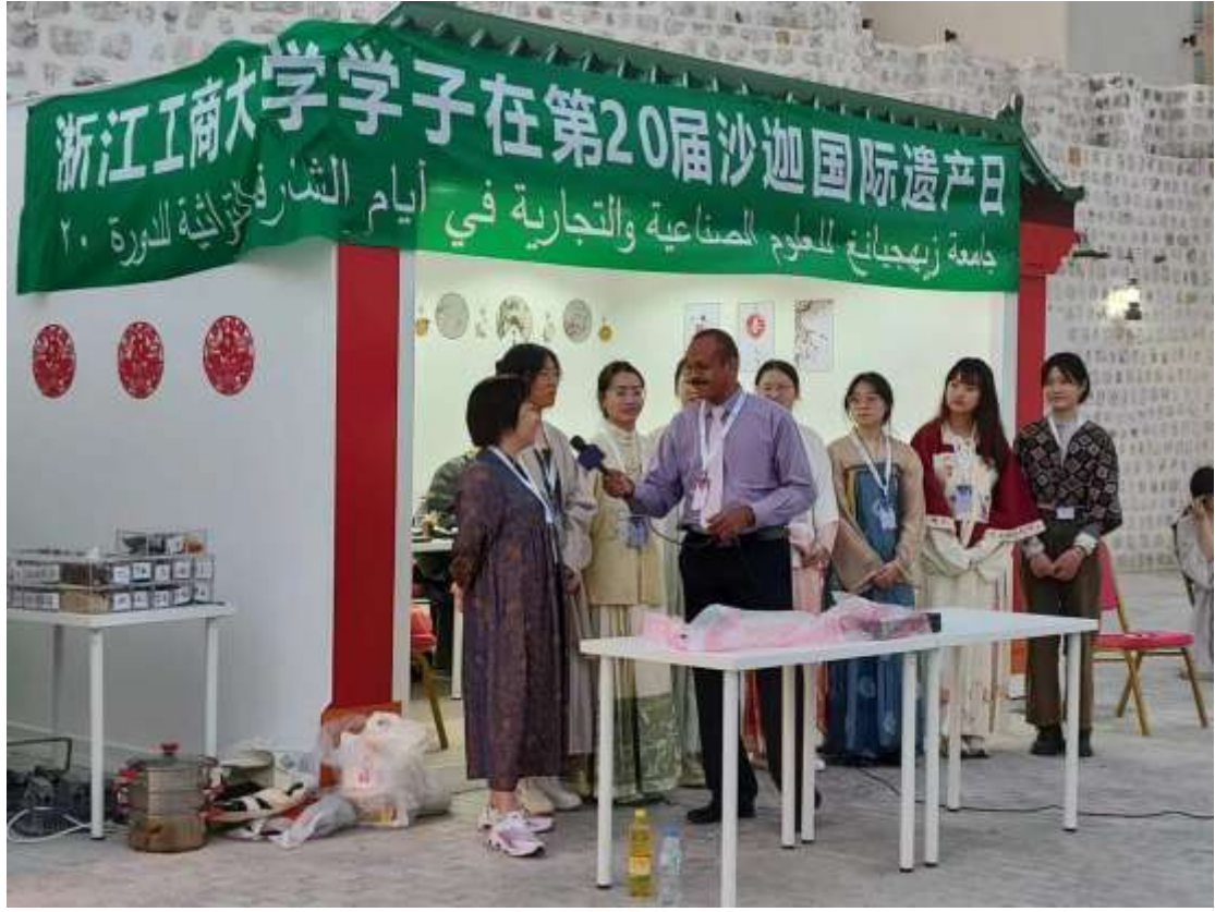
(الصور أعلاه هي لرئيسة قسم اللغة العربية وطلابها وهم يجرون مقابلة مع إحدى المحطة التلفزيونية)