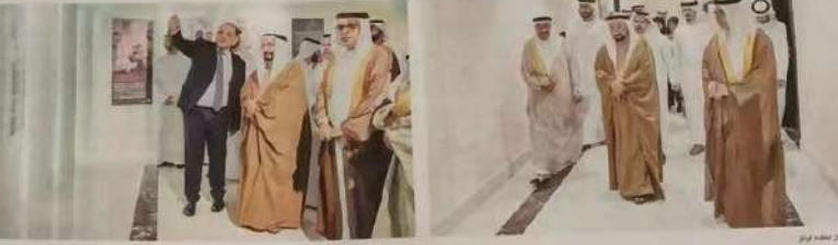
سلطان بن عبدالعزيز آل سعود

إيكروم - المشاركة بين ست منظمات دولية مخصصة يضمها المركز