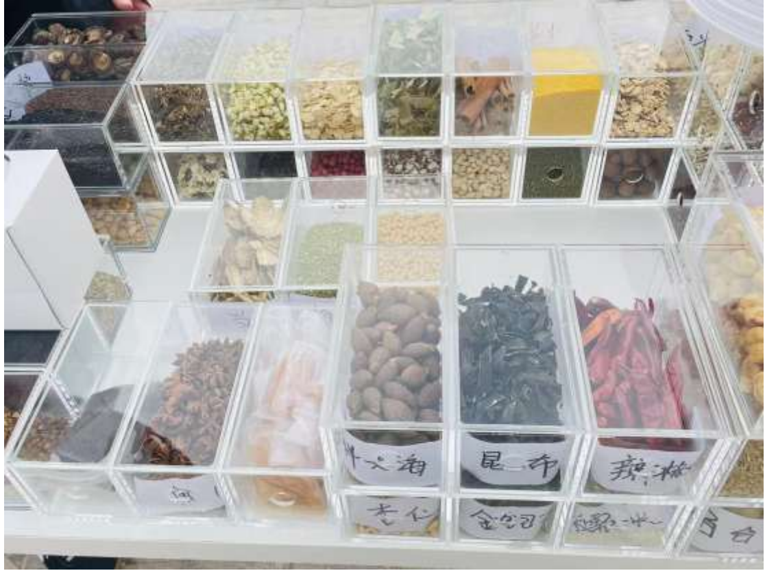
(صورة تظهر مواد طبية مختارة من الأجهزة الطبية والغذائية المتماثلة)