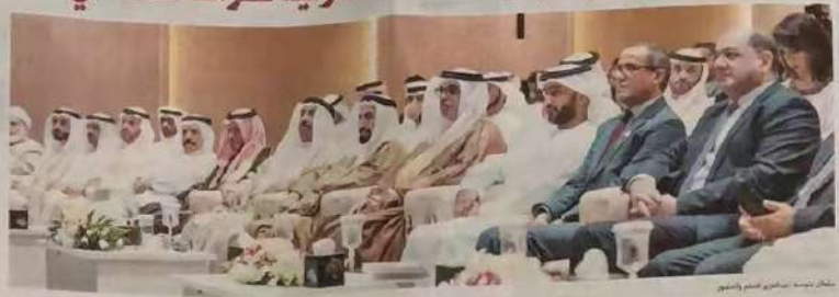
سلطان بن عبدالعزيز آل سعود

نجلو باروقته في المدينة الجامعية واطلع على العرض