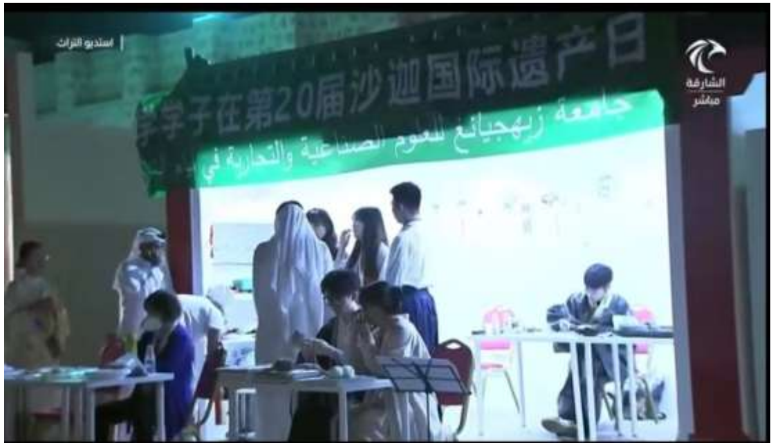
(صورة تظهر قناة الشارقة في بث مباشر من الحدث)