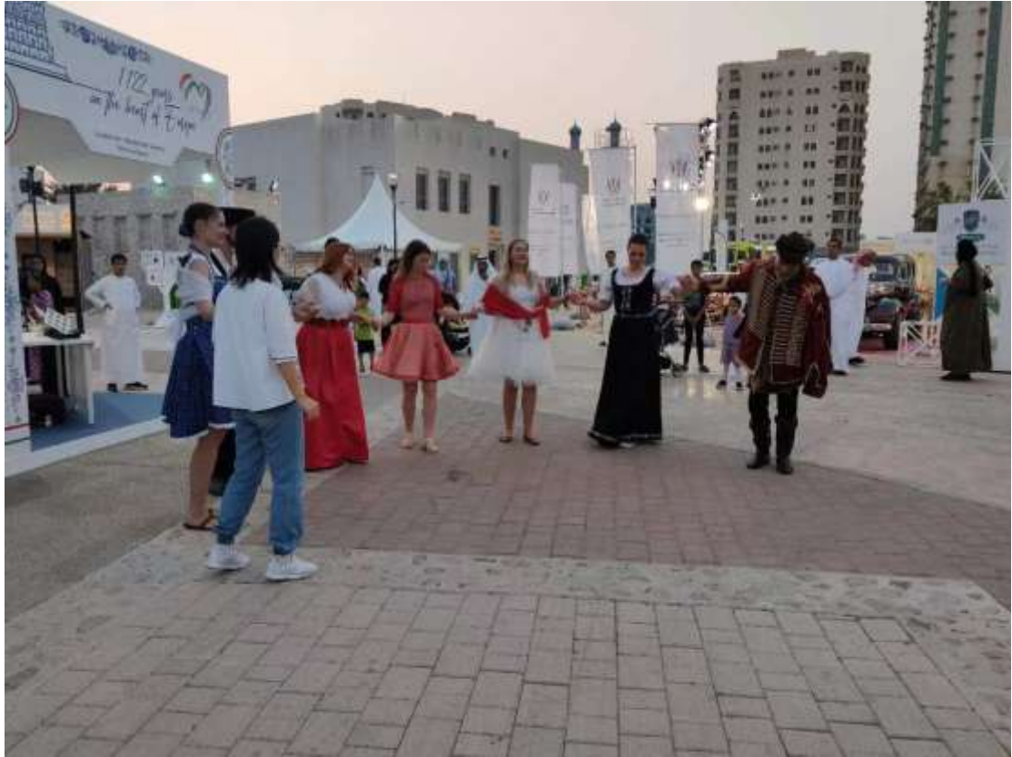
(صورة توضح أنشطة وفعاليات الوفد المجري ضيف شرف هذه الدورة)

في الأول من شهر مارس بالتوقيت المحلي لدولة الإمارات العربية المتحدة، أفتتحت فعاليات "أيام الشارقة التراثية" الدورة الـ«20» لعام 2023م في إمارة الشارقة بدولة الإمارات العربية المتحدة، تحت شعار "التراث والابتكار"، والذي استمر لمدة 20 يوماً. دعا المنظمون ما مجموعه 42 دولة ومنظمة من الصين والمملكة العربية السعودية ومصر وروسيا واليونان والمجر والنمسا وإيطاليا وبولندا وهولندا وبلجيكا وفرنسا وإسبانيا والبرتغال وأيرلندا، إلخ، لعرض الثقافات التقليدية والفنون الشعبية من جميع أنحاء العالم في طرق متعددة الأوجه والجوانب، وتزويد الجمهور بتبادلات متعمقة بين الثقافات واللغات.