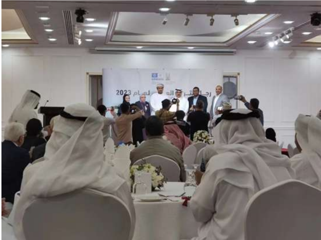
(صورة توضح المأدبة التي أقامها منظم الفعالية وجميع المدعوين المشاركين)

في هذا النشاط وبمناسبة أيام المشاركة العالمي للتراث الثقافي، استجاب الوفد الصيني (قسم اللغة العربية، جامعة تشجيانغ للعلوم الصناعية والتجارية) بنشاط لمبادرة "الحزام والطريق"، وعزز الثقافة الشعبية الصينية الممتازة من خلال التعاون مع مركز التعاون اللغوي لتنظيم معرض لثقافة الطعام والثقافة المعمارية الصينية، وروح للثقافة الشعبية الممتازة والتراث الثقافي التقليدي للصين، وسعى جاهدا لسرد "القصص الصينية" بشكل جيد، والقيام بإنشاء "سجل صيني" جيد، والسماح للعالم بسماع "الصوت الصيني"، والسماح لمزيد من الأصدقاء في الخارج بمعرفة الثقافة الصينية وفهمها وحبها، وتوسيع تأثير نفوذ القوة الناعمة الثقافية للصين في الخارج.