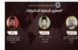
مبادئ تعليم الكلمات العربية للناطقين بلغات أخرى