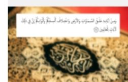
معايير لادة اللغوية لنماذج غير الناطقين بالعربية