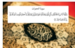
أخطاء متعلمي العربية الأجنبي وأسبابها