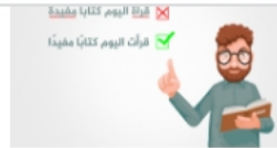
معا نخدم لغة القرآن