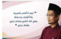
بالقرآن تعلم العربية (1)