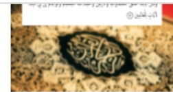
بالقرآن تعلم العربية (8)