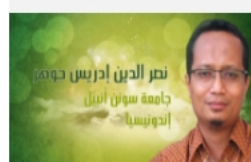
بالقرآن تعلم العربية (7)