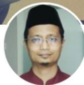
الدكتور نصر الدين إدريس جوهري أساذ العربية بجامعة سونن أنبيل- إندونيسيا