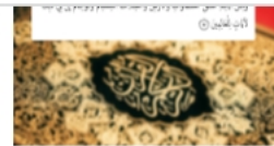
بالقرآن تعلم العربية: الأخطاء اللغوية (10)