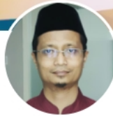
الدكتور نصر الدين إدريس جوهري أستاذ العربية بجامعة سونن أنبيل- إندونيسيا