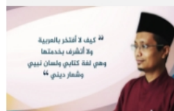
معا نخدم لغة القرآن