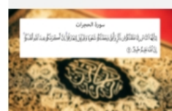
لماذا يدرسون العربية؟