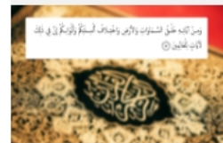
بالقرآن تعلم العربية (6)