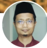
الدكتور نصر الدين إدريس جوهري أستاذ العربية بجامعة سونن أنبيل- إندونيسيا