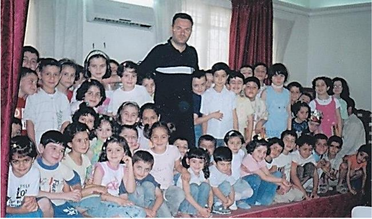
أثناء تسجيل مسرحية (المستقبل) من تأليف الدكتور مصطفى وأداء أطفال النادي في مقر الإذاعة والتلفزيون في دمشق - 2009