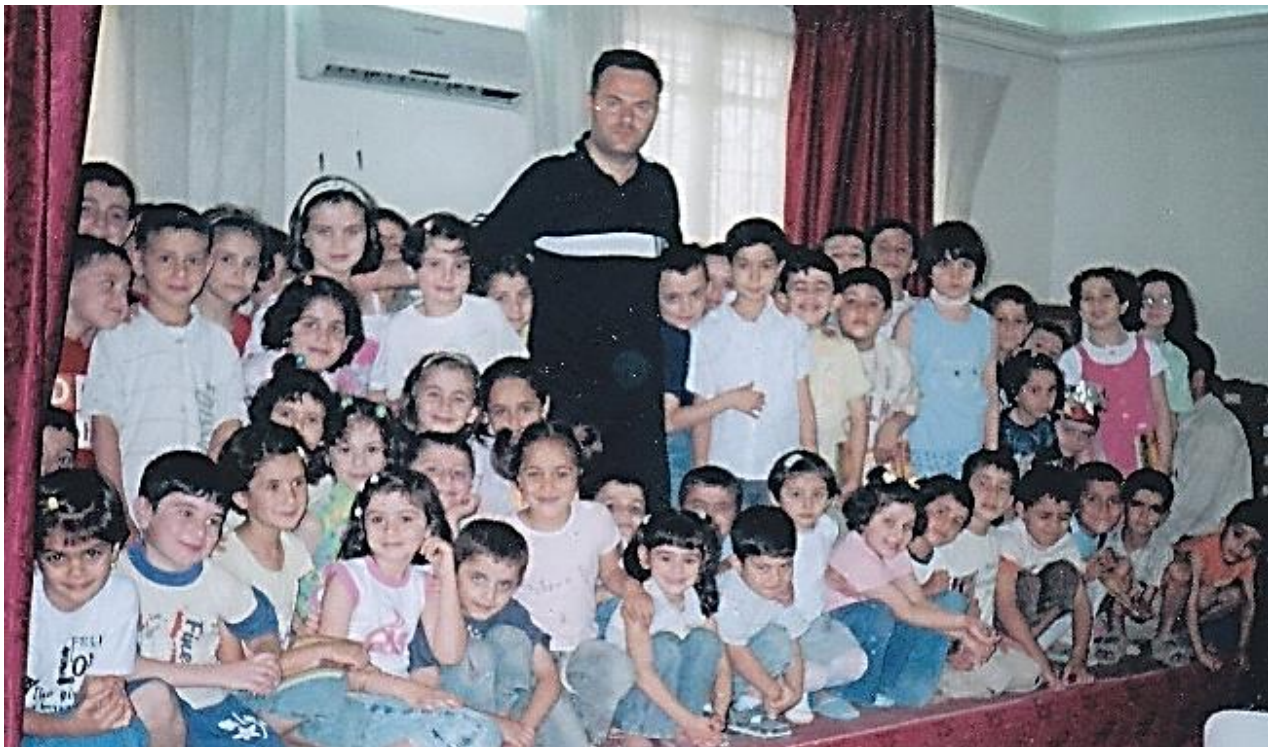
أثناء تسجيل مسرحية (المستقبل) من تأليف الدكتور مصطفى وأداء أطفال النادي في مقر الإذاعة والتلفزيون في دمشق - 2009