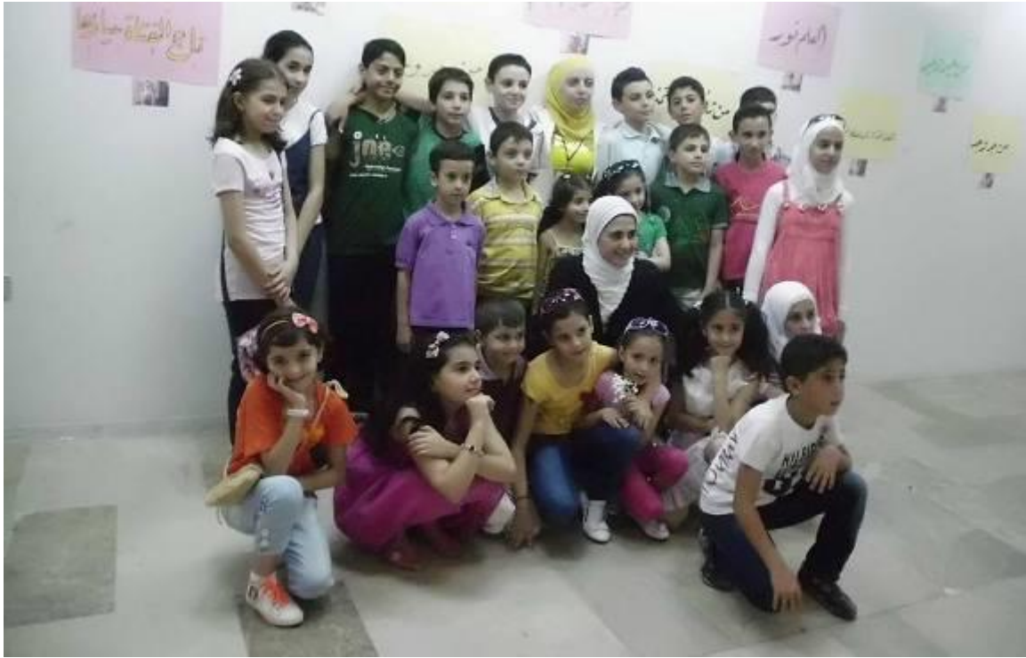
جلسات النشاطات الأدبية في (نادي القراءة والإبداع) – قراءات إبداعات الأطفال ومناقشتها - 2013