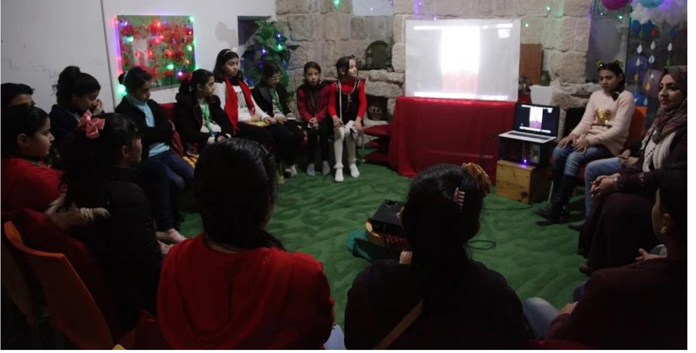
أنشطة قرآنية وفنية لمدير النادي مع أعضاء جدد في مراكز إيواء اللاجئين في شمال سورية لتعويضهم عن ابتعادهم عن التعليم - 2021