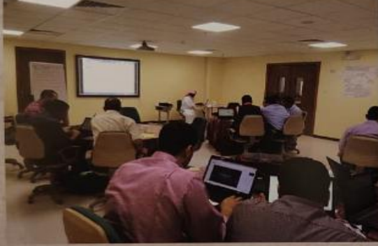
برنامج نور :

رفع المستوى التقني للطلاب وسبل التعامل مع الشبكة العنكبوتية كما عرفوا من خلاله طرق التواصل مع الطلاب وأولياء الأمور خارج أسوار المدرسة.