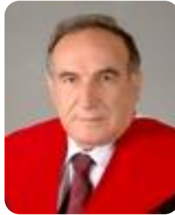
أ.د. نهاد الموسى