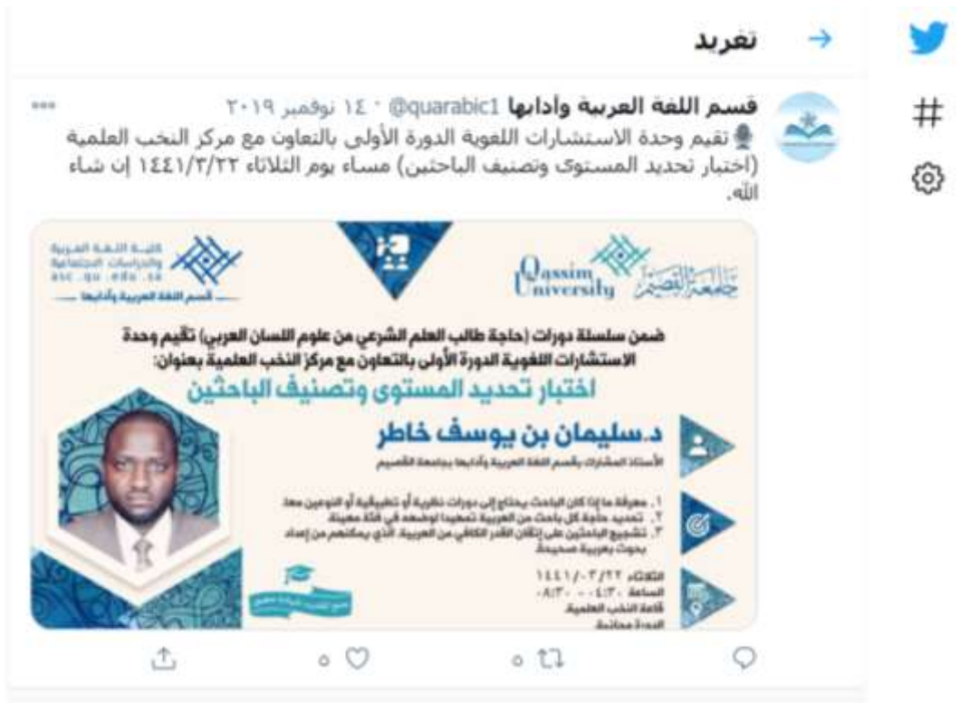
توثيق مصور لفعاليات الدورة التدريبية: